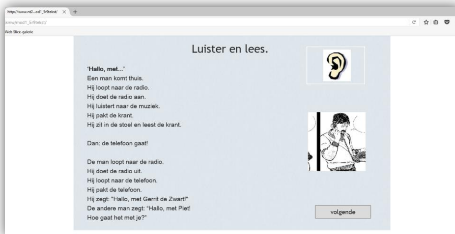
De nieuwe online versie van Je Kan Me Wat

In het vorige inhoudelijk jaarverslag spraken we de verwachting uit dat de nieuwe versie ergens rond het begin van de zomervakantie 2016 gerealiseerd zou zijn. Dat bleek te optimistisch, de praktijk was weerbarstiger. Met name de technische details en de finetuning van de weergave van de methode op de verschillende formaten voor mobieltjes bleken voor meer werk te zorgen dan aanvankelijk was ingeschat. Uiteindelijk duurde het tot februari 2017 voordat de methode definitief gelanceerd kon worden. Nogmaals willen we hier onze grote dank uitspreken voor het Amsterdamse bedrijfsleven, dat ons via 'De tafel van BASTA' (Bedrijfsleven Amsterdam Samen Tegen Armoede) in staat stelde om 4 licenties aan te schaffen van het benodigde softwareprogramma Adobe Captivate om het programma te vernieuwen.