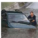
het regent soms heel hard

In de hele wereld wordt het warmer, en ook in Nederland. Sinds 1900 is het in Nederland 1,7 graden warmer geworden. En sinds 1950 valt er 20% meer regen. Het is niet zo dat het meer dagen regent. Maar als het regent, regent het harder: er valt meer water, soms in een korte tijd.