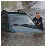
het regent soms heel hard

In de hele wereld wordt het warmer, en ook in Nederland. Sinds 1900 is het in Nederland 1,7 graden warmer geworden. En sinds 1950 valt er 20% meer regen. Het is niet zo dat het meer dagen regent. Maar als het regent, regent het harder: er valt meer water, soms in een korte tijd.