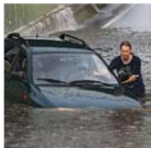
het regent soms heel hard

In de hele wereld wordt het warmer, en ook in Nederland. Sinds 1900 is het in Nederland 1,7 graden warmer geworden. En sinds 1950 valt er 20% meer regen. Het is niet zo dat het meer dagen regent. Maar als het regent, regent het harder: er valt meer water, soms in een korte tijd.