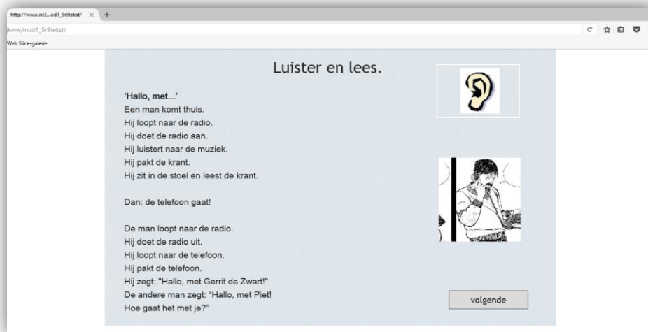
De nieuwe online versie van Je Kan Me Wat

De volgende logische stap was een revisie van de online versie, met als grootste klus de omzetting van de oefeningen naar html-5 om ze geschikt te maken voor tablets en smartphones. Oorspronkelijk was het de bedoeling om de nieuwe versie voor de zomervakantie van 2016 online te zetten. De klus bleek nog groter dan aanvankelijk verwacht, maar in februari 2017 konden we dan toch de nieuwe versie lanceren. We verwachten veel van deze nieuwe versie, met name ook gezien de grote instroom van asielzoekers die te vaak kostbare tijd verliezen met wachten tot ze erkend worden. Er is dus volgens ons grote behoefte aan een programma waarmee zij vanaf dag 1 zelfstandig op hun mobieltje kunnen beginnen met de taal leren. En zo'n programma is Je Kan Me Wat.