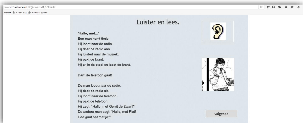
De online versie van Je Kan Me Wat

Naast het ontwikkelen van de nieuwe versie van de site met hulp van ICT4Free was het ontwikkelen van een nieuwe, responsieve versie van Je Kan Me Wat een belangrijke stap vooruit. Je Kan Me Wat is een volledige methode van A0 tot A1, besteedt aandacht aan alle aspecten van het leren van een taal, is goed zelfstandig te gebruiken, is geschikt voor