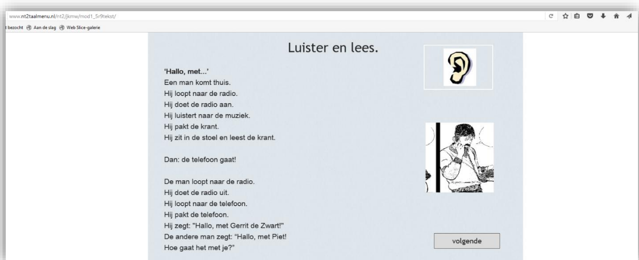
De online versie van Je Kan Me Wat

Het ontwikkelen van een nieuwe versie van Je Kan Me Wat was een belangrijke stap vooruit. Je Kan Me Wat is een volledige methode van A0 tot A1, besteedt aandacht aan alle aspecten van het leren van een taal, is goed zelfstandig te gebruiken, is geschikt voor laaggeletterden en minder studievoordige cursisten, en last but not least: het is geheel gratis.