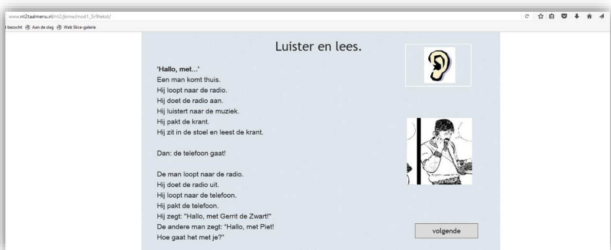
De online versie van Je Kan Me Wat

Het ontwikkelen van een nieuwe versie van Je Kan Me Wat was een belangrijke stap vooruit. Je Kan Me Wat is een volledige methode van A0 tot A1, besteedt aandacht aan alle aspecten van het leren van een taal, is goed zelfstandig te gebruiken, is geschikt voor laaggeletterden en minder studievoordige cursisten, en last but not least: het is geheel gratis.