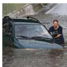
het regent soms heel hard

In de hele wereld wordt het warmer, en ook in Nederland. Sinds 1900 is het in Nederland 1,7 graden warmer geworden. En sinds 1950 valt er 20% meer regen. Het is niet zo dat het meer dagen regent. Maar als het regent, regent het harder: er valt meer water, soms in een korte tijd.