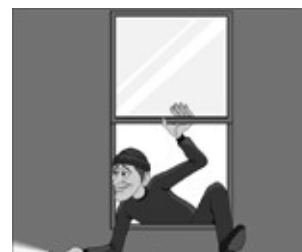
Is dit ook werk ?

8 Begrijpt de zangeres hoe Ome Jan aan het geld voor alle cadeautjes komt?